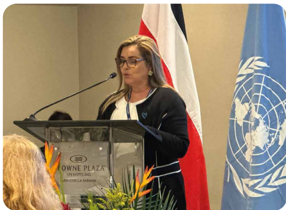
Directora de la DGME y Presidenta de la CONATT.

El 6 de junio del 2023 se realizó el lanzamiento del Programa Conjunto “Costa Rica: Fortalecimiento de la capacidad de los organismos de orden público y justicia penal para coordinar e intercambiar información para investigar y perseguir la trata de Personas y el tráfico ilícito de migrantes”, financiado por el Fondo Fiduciario de Asociados Múltiples para la Migración (Migration Multi-Partner Trust Fund/MMPTF, por sus siglas en inglés), liderado por la Coalición Nacional contra la Trata de Personas y el Tráfico Ilícito de Migrantes (CONATT) y la cooperación técnica de la Organización Internacional para las Migraciones (OIM), la Entidad de las Naciones Unidas Contra la Droga y el Delito (UNODC) y la Entidad de las Naciones Unidas para la Igualdad de Género y el Empoderamiento de las Mujeres (ONU Mujeres).