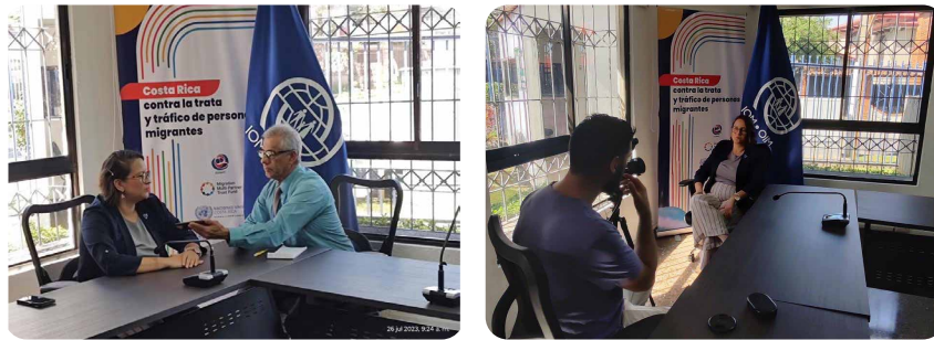
Ronda de entrevistas

Ronda de entrevistas uno a uno con la coordinación del programa para presentación del proyecto y sensibilización del tema previo al 30 de Julio.