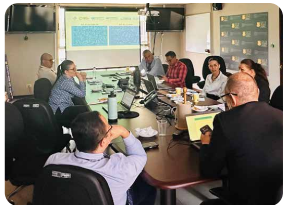
Grupo Focal con autoridades de OIJ © IOM 2023.

Parte de este diagnóstico incluye levantamiento de necesidades de capacitación para formular un Plan de Capacitación, validado con la Comisión Técnica, para cuerpos policiales y órganos y agencias de justicia no solo para la recolección e intercambio de datos, sino también para mejorar los sistemas de identificación y gestión de víctimas de trata.