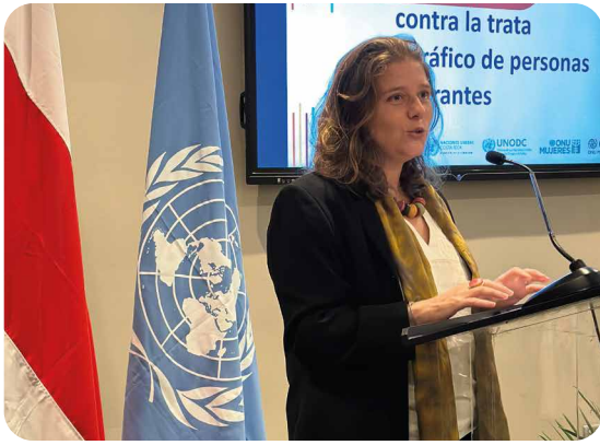
Jefa de misión de la OIM © IOM 2023.

Para la coordinación y seguimiento a la implementación, la CONATT en conjunto con las agencias de Naciones Unidas, establecieron una Comisión Especial Técnica, acordando reuniones bimensuales, la primera experiencia de esta naturaleza en la historia de la CONATT.