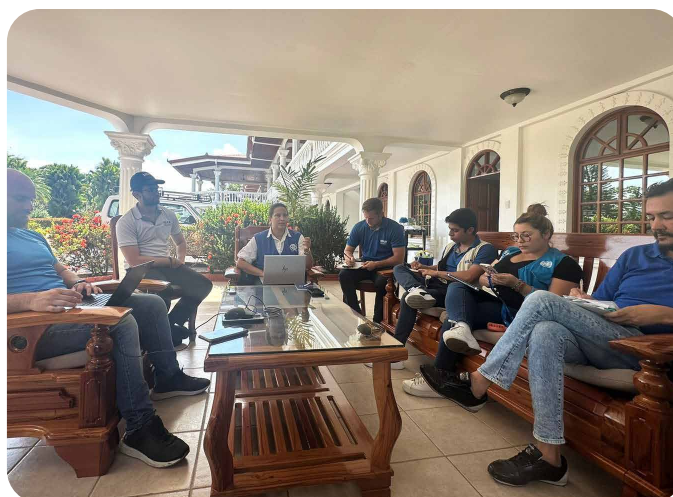
Reunión Coordinadora del Programa Conjunto con agencias de la ONU en Paso Canoas © IOM 2023.