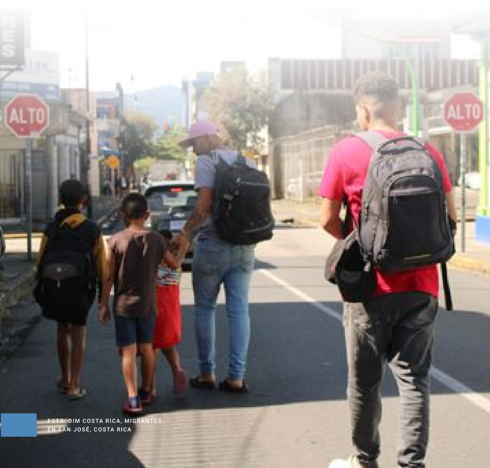
MIGRANTES EN SAN JOSÉ, COSTA RICA