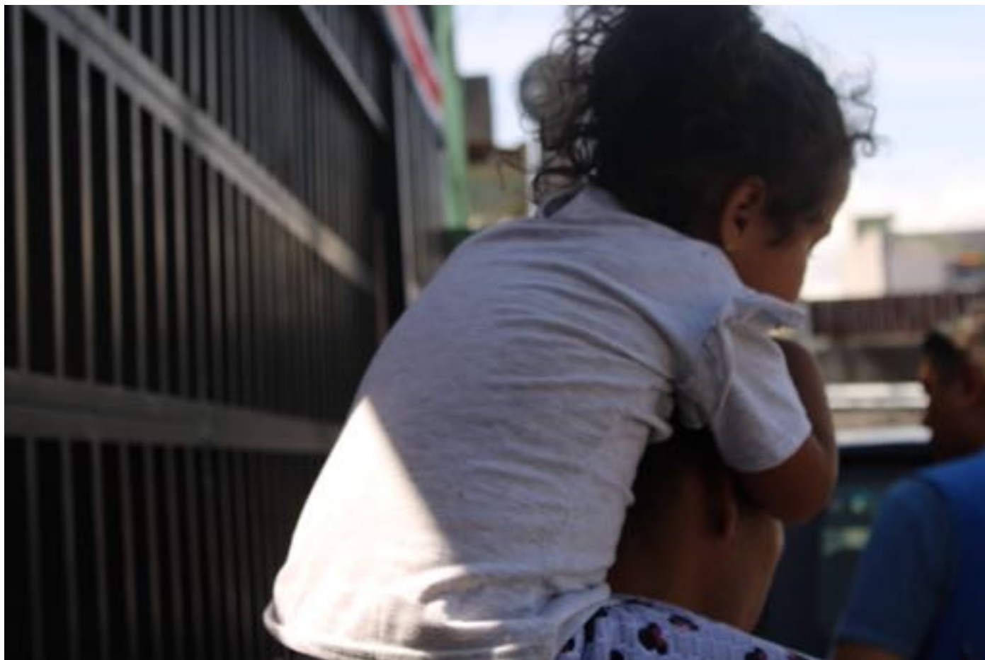
MIGRANTES EN SAN JOSÉ, COSTA RICA.

Dado el gran aumento del número de personas en tránsito por las Américas, Costa Rica requiere apoyo rápido para garantizar que la migración se produzca de forma segura y ordenada, y que responda a las necesidades humanitarias.